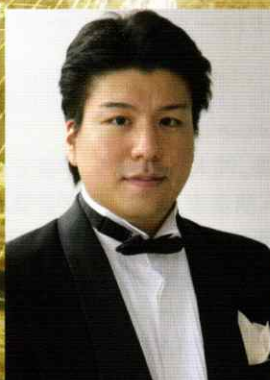
本多 信明 (テノール) Nobuaki Honda, tenor