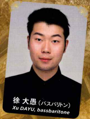
徐大愚 (バスバリトン) Xu DAYU, bassbaritone