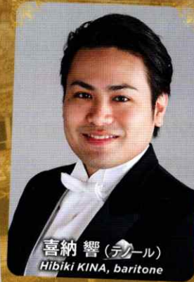
喜納響 (テノール) Hibiki KINA, baritone